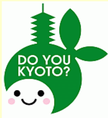
●シンボルキャラクター

地球温暖化防止の国際的な取り決めである京都議定書が発効(2005年)した2月16日は「京都地球環境の日」。この日の前後には、様々な記念イベントが開催されます。